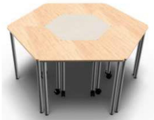
Element Esagono più 6 Element Trapezio