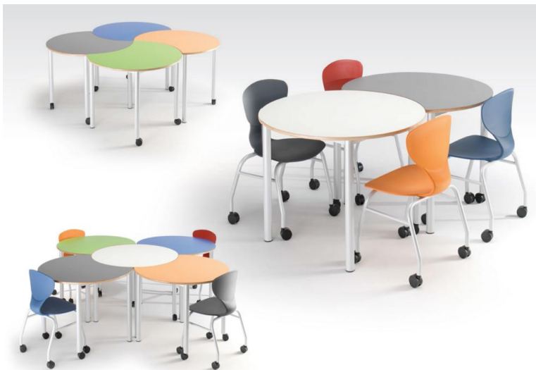
Element Cerchio e Element Mela