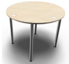
Element Cerchio e Element Mela