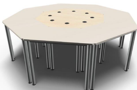
Element Ottagono più 8 Element Trapezio